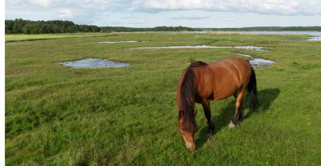
Beiting på Kure strand